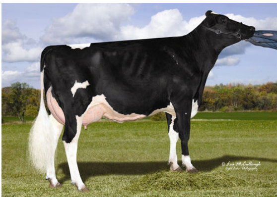
COOKIECUTTER MOM HALO FIFTH DAM