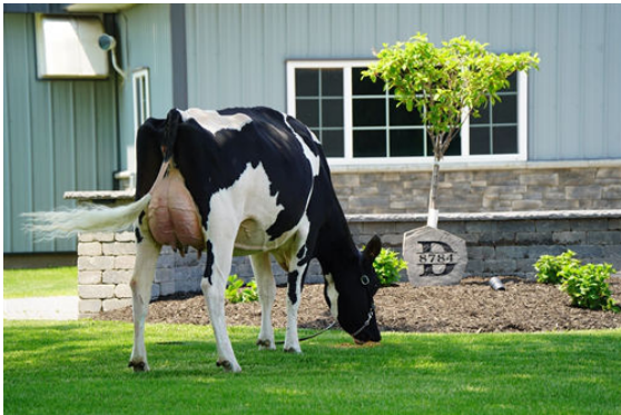
DUCKETT RANGER 1133 DAM